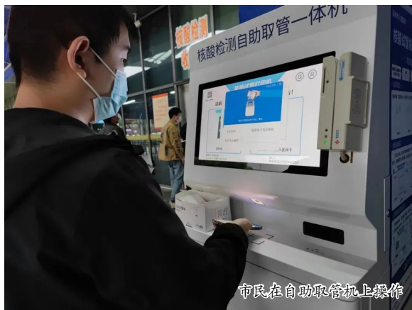
市民在自助取管机上操作

不断提升核心竞争力,加快实现“打造员工满意、百姓信赖的现代临床研究型医院”阶段性战略目标。向2035年“浙江名院”远景目标奋进。